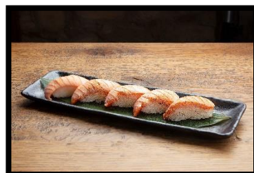
Aburi Shake Platte