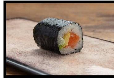
Shake & Avo Maki

Lachs, Avocado, Reis, Nori, Wasabi, Ingwer