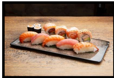
Altstadt Platte (für 1 Person)

4x Uramaki, 3x Hosomaki, 2x Shake Nigiri, 2x Mango Nigiri, 1x Ebi / Ama Ebi Nigiri