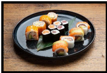
Taverne Platte (für 1 Person)

4x Shake Rainbow Roll, 4x California Roll, 3x Tekka Maki, 3x Shake Maki